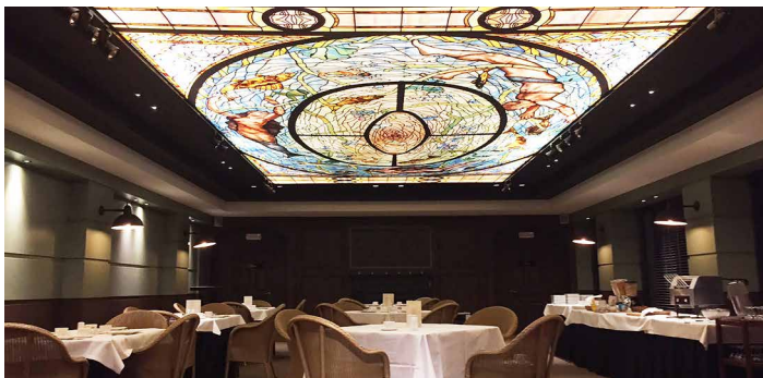
Restaurant - Belgique - Plafond imprimé rétroéclairé Réalisation : MONAVISA

...des avantages CLIPSO® pour murs et plafonds en hôtels et restaurants :