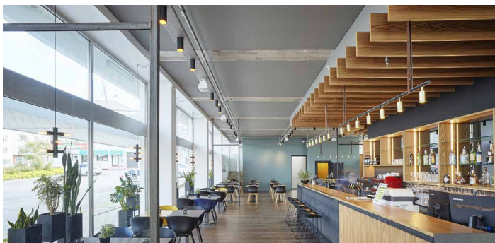
Bar - Restaurant - ISLANDE - Plafond acoustique couleur Installation : ENSO