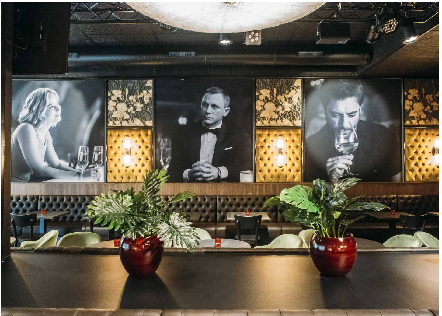
Restaurant Imagix - BELGIQUE - Cadres muraux imprimés noir & blanc - Installation : MONAVISA