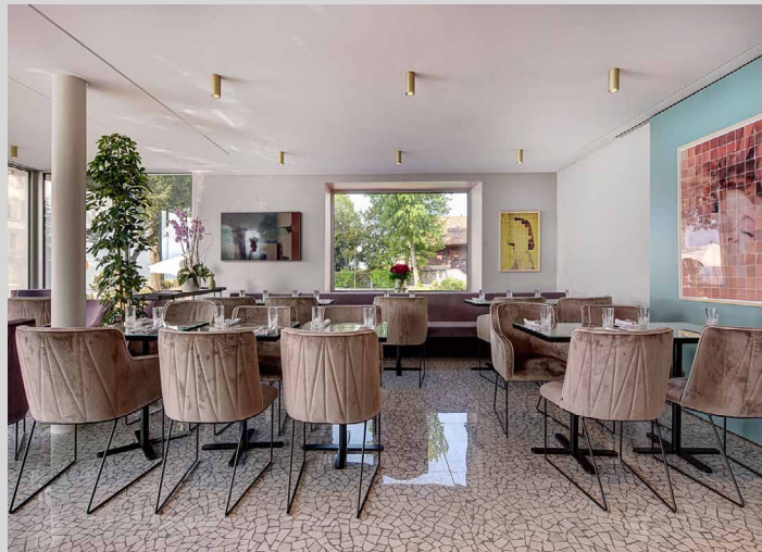
Hôtel du Léman - SUISSE - Plafonds acoustiques couleur blanc Installation : ABRILUM