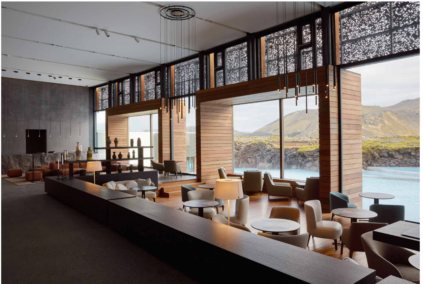
Hôtel Blue Lagoon - ISLANDE - Plafonds acoustiques blanc et couleur - Architecte : Basalt Architects - Installation : ENSO