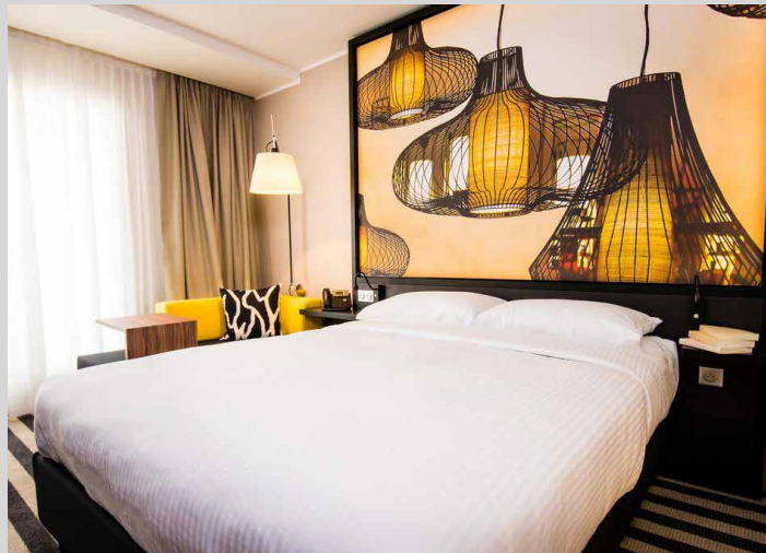
Hôtel Pointe Simon - Martinique - FRANCE Cadres rétroéclairés imprimés - Installation : DL2A