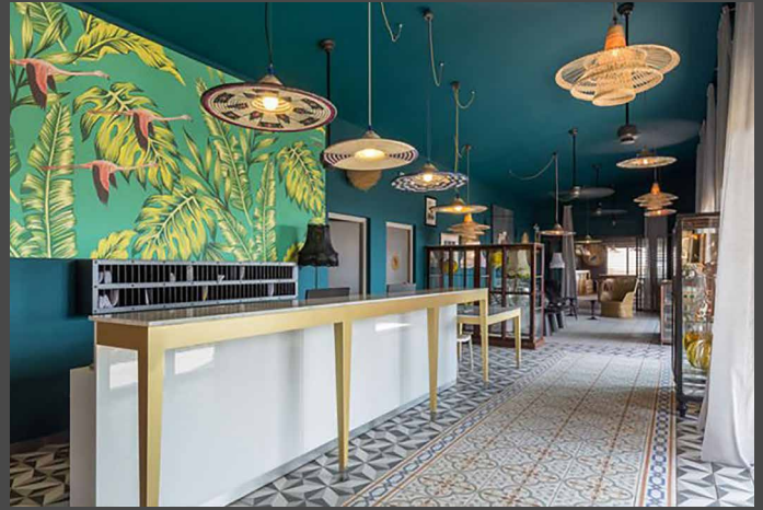
Hôtel Dina Morgabine Hermitage - La Réunion - FRANCE Cadre mural imprimé - Installation : Côte Bleue Installation