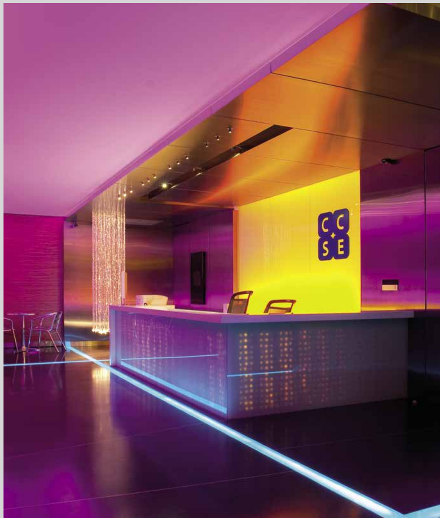
Bureaux - Thaïlande - Revêtements rétroéclairés RGB - Réalisation : CCSE