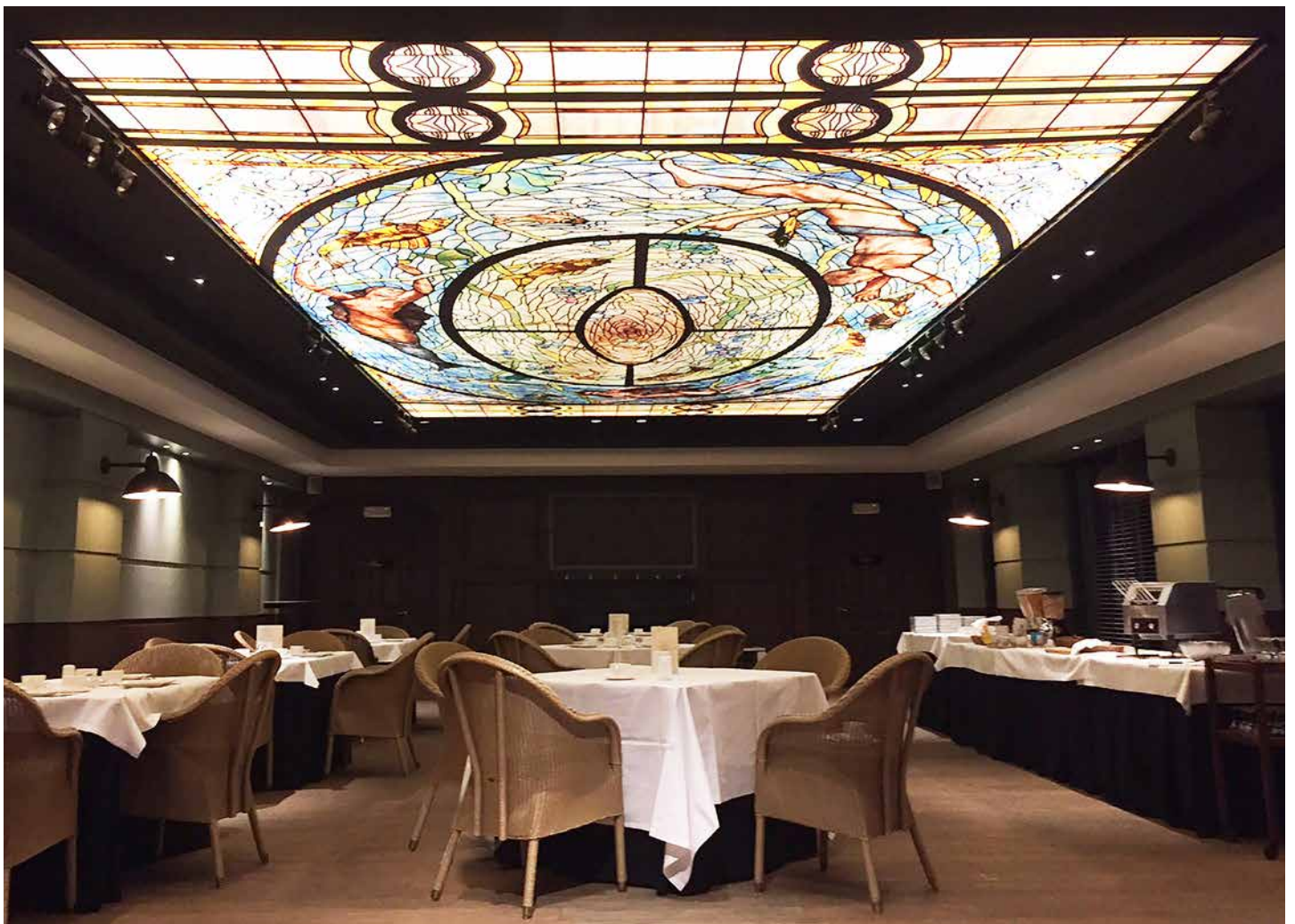
Restaurant - Belgique - Plafond imprimé rétroéclairé - Réalisation : MONAVISA

Nos ateliers sauront créer le luminaire dont vous avez besoin, nous concevrons pour vous la forme la mieux adaptée et vous proposerons diverses intensités lumineuses. Cette forme sera moderne, élégante, esthétique ou épurée... Conforme à vos envies !