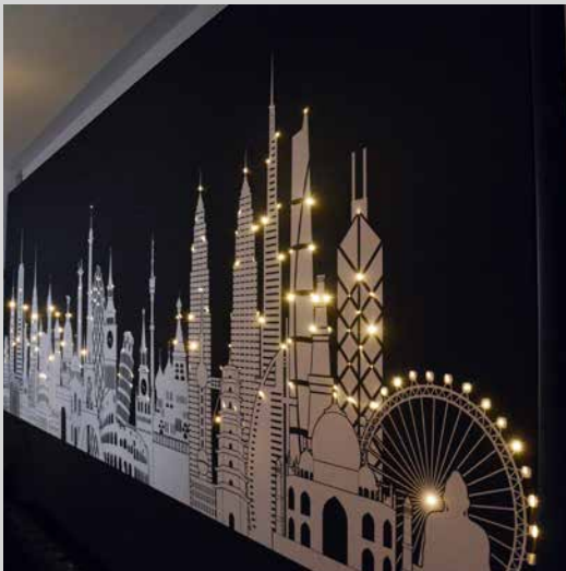
Mur imprimé avec fibre optique intégrée France - Réalisation : CLIPSO PRODUCTION

Embarquez dans les étoiles avec les fibres optiques intégrées dans nos toiles ! Aux murs ou aux plafonds vous créez ainsi une ambiance unique qui fait rêver.