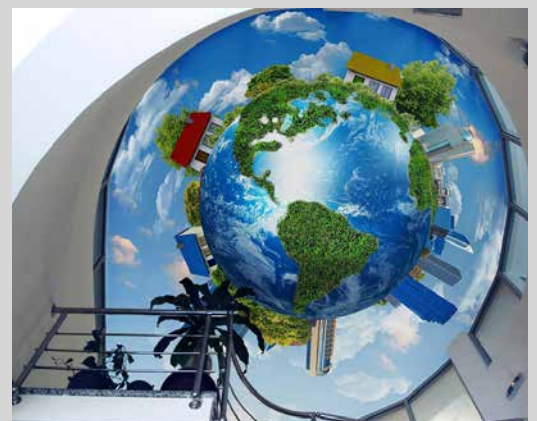
Plafond trompe l'oeil rétroéclairé - Allemagne Réalisation : Baumann

Certains espaces publics sont désormais pensés pour que l'acoustique soit la plus agréable possible, centres commerciaux dans lesquels le bruit omniprésent doit être atténué, ou cabinets médicaux où la discrétion est nécessaire.