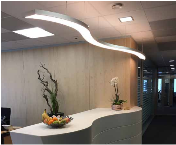
Structures aluminium rétro-éclairées - Luminaire Suisse - Réalisation : Linsi-tech

La compatibilité des LED avec nos toiles vous offre une personnalisation totale : un revêtement imprimé avec l'image de votre choix ou une création d'artiste créeront une atmosphère unique.