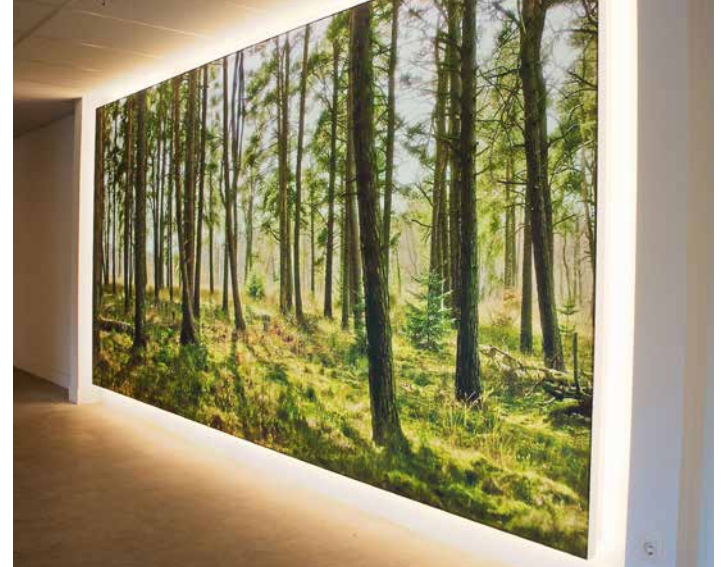
Caisson mural - Belgique - Revêtement imprimé rétroéclairé Réalisation : City Outdoor

Envie de jouer sur l'intensité lumineuse ou les couleurs ? Là encore l'association d'un certain type de LED vous permettra de créer cette ambiance personnalisée douce et chaleureuse.