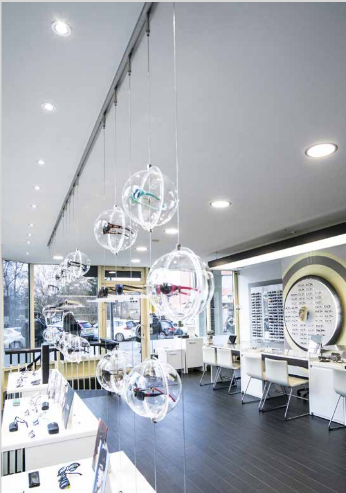
Magasin d'optique - Intégration de spots et caissons rétroéclairés - Allemagne - Réalisation : Optimaler

Embellissez tout votre espace avec un effet lumineux qui simule la lumière du jour.