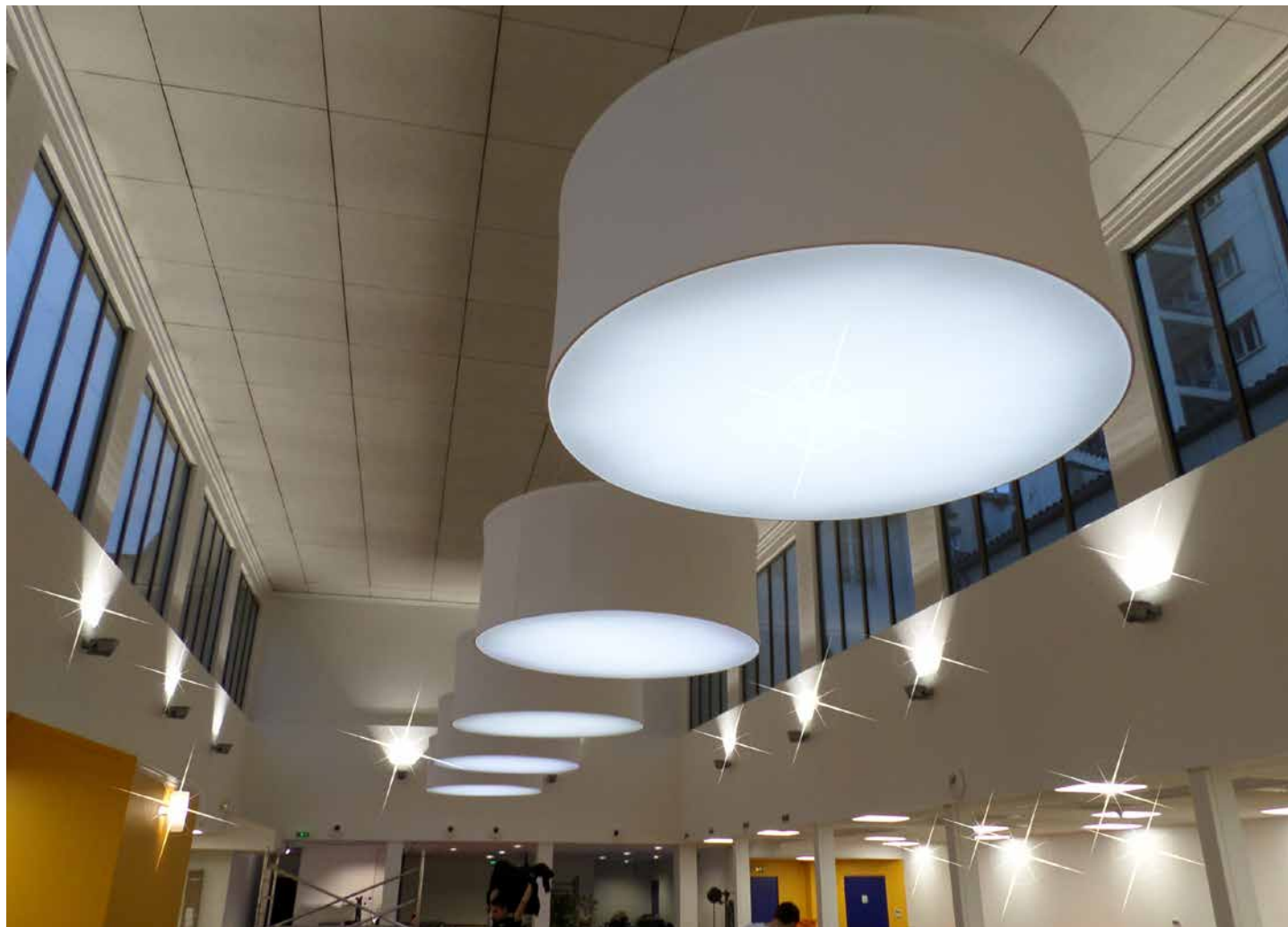
Centre commercial - Luminaires XXL en structures aluminium - Toiles rétroéclairées - France - Réalisation : SPIDER DESIGN

La lumière nous est nécessaire, vitale même : elle régule notre organisme et notre humeur.