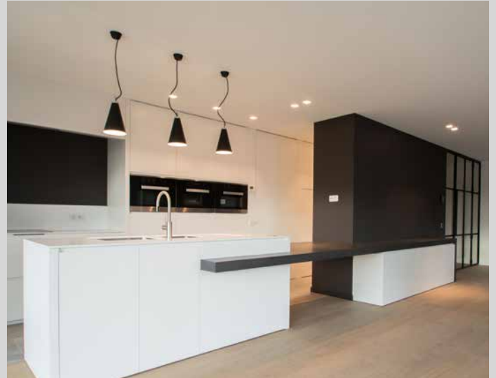
Résidentiel - Plafond acoustique avec intégration de luminaires spots - Belgique - Réalisation : MONAVISIA

Mettez en valeur vos produits dans vos magasins et showrooms avec un rendu lumineux moderne et immaculé.