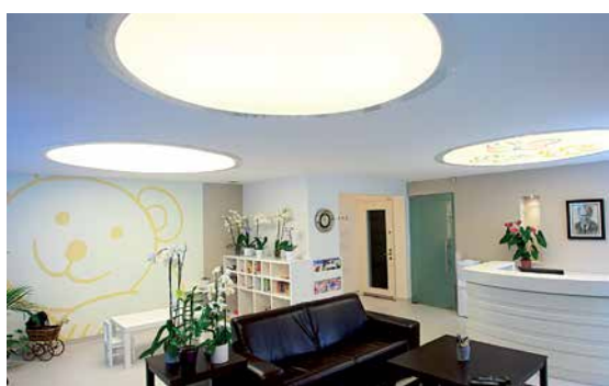
Clinique Dentaire - Plafond avec cercles rétroéclairés

La lumière nous est nécessaire, vitale même : elle régule notre organisme et notre humeur.