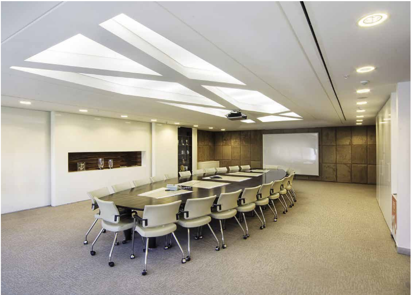
Salle de réunion UNILEVER - Plafond avec structure rétroéclairée